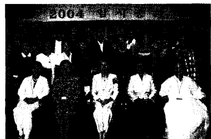
◀지난 8월 25일 한국지식재산센터 19층 국제회의실에서 개최된 '한국여성발명협회 2004 임시총회'에 참석한 회원들의 기념촬영 모습.

이번 임시총회에 참석한 회원들은 총회를 통해 협회 발전에 기여하고 오찬을 통해 협회 회원간의 안부를 묻고 친목을 다지는 시간을 가졌다.