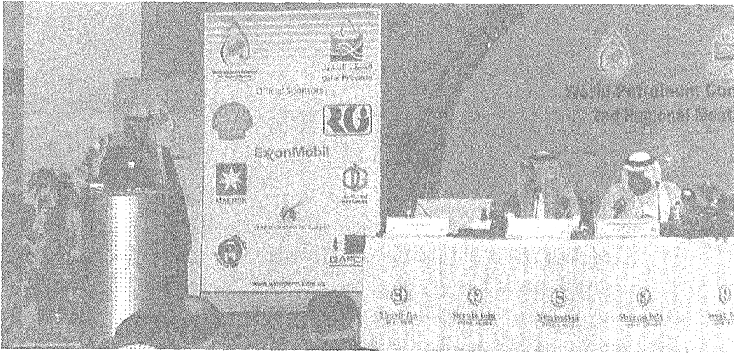
세계석유회의는 1933년 영국, 런던에서 1차 총회를 개최한 국제석유회의로 석유산업의 전 분야에 걸친 최신 정보와 기술을 교류하는 비정치적 중립조직이다.