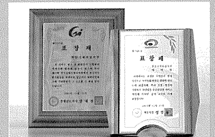
천안시지부가 작년 시청 주관 장애인 체육대회에서 봉사한 공로로 천안시청에서 표창패를 받았다.