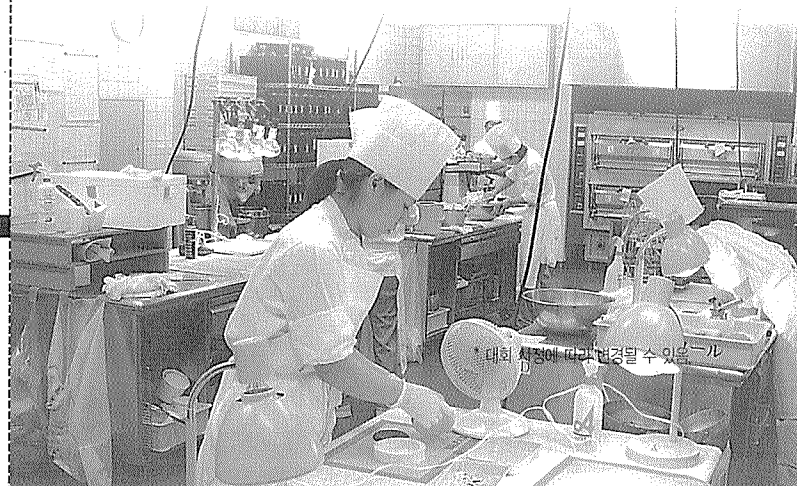
*대회 현장에 따라 변경될 수 있음 - 1