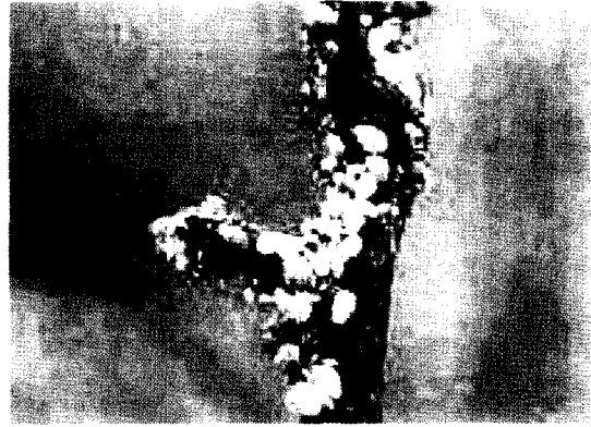
▲ 가지를 가해하는 성충과 약충