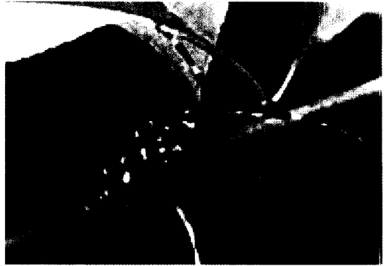
▲ 후식하고 있는 알락하늘소 성충

주로 년 1회 발생하며, 간혹 2년 1세대인 경우도 있다. 성충은 6월 중순에서 7월 중순에 우화하여 가해부위에서 탈출한다. 탈출한 성충은 수피나 잎의 후식하여 우화탈출한지 8-12일 경부터 산란하기 시작한다. 산란은 지표 부근의 수피를 입으로 물어뜯고 수피와 목질부 사이에 1개씩 낳으며 한 마리의 산란수는 30-120개 정도이고 하루 평균 1-4개의 알을 낳는다. 아기간은 10-15일 정도이고 부화한 유충은 처음에는 껍질 밑에서 식해하다가 나중에는 목질부 깊이 먹어 들어간 후 위로 향하여 먹어 올라간다. 침입공으로 톱밥을 배출하므로 발견하기 쉽다. 노숙한 유충으로 월동하여 5월에 갯도 끝에서 번데기가 되며 번데기 기간은 20-30일 정도이다.