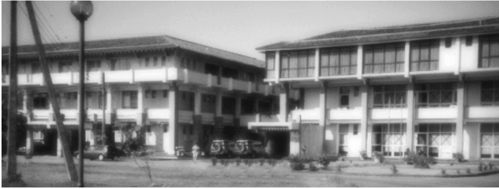
콜롬보한국교육대학 전경 ▲

아가 좌측의 아프리카, 우측의 아시아, 위쪽의 중동시장 진출의 거점이 될 수 있는 탁월한 지리적 여건을 가진 나라이다.