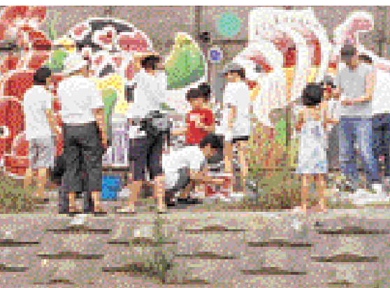
▲ 도림천 벽화그리기 행사