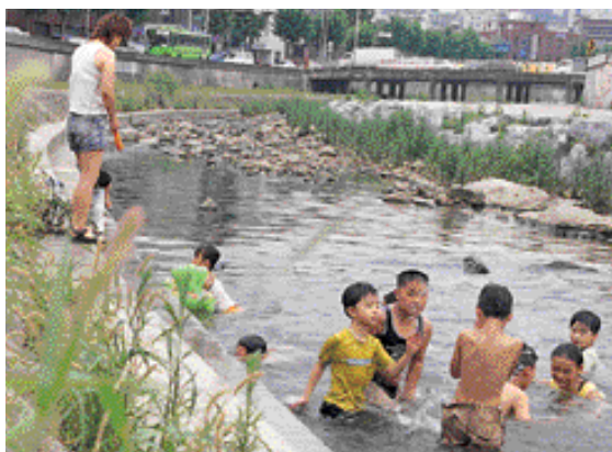
▲ 도림천에서 물놀이하는 어린이들