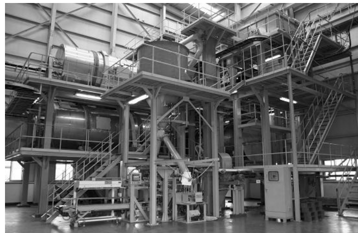
그림 3) 시공 중인 슬러지 부속(퇴비화) 시설 전경