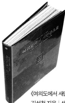
《여의도에서 새만금으로》 김석철 지음 | 생각의나무 | 368쪽 | 값 35,000원

단했어요. 만약에 그 당시 김수근 선생을 찾아가지 않았다면 제 인생은 완전히 달라졌을 겁니다. 다른 건축 전공자들처럼 곧바로 유학을 갔을 테고 지금처럼 도시설계, 도시계획에 손을 대지도 않았겠죠.”