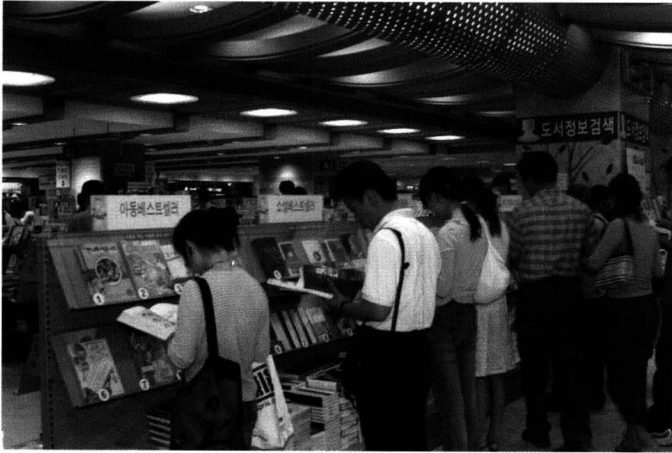
불황이고 읽을 책이 없다고 하지만 책의 물리적 특성을 차별화함으로써 새로운 틈새가 열리지 않을까.

혼자가 아닌 친구들과 어울려 읽는 책에서는 단순히 읽는 재미뿐만 아니라 '어우러진 삶'에 대한 교육효과도 쉽게 기대할 수 있다. 기껏해야 대여섯 살 철없는 어린 아이지만 여럿이 함께할 수 있도록 책을 독차지하지 않고, 친구가 다 읽을 때까지 페이지를 넘기지 않으며 참고 기다려야 하는 데서 이해와 양보를 배울 것이다. 친구와 더불어 울고 웃으면서 아이의 독서체험은 혼자 읽을 때보다 풍부해진다.