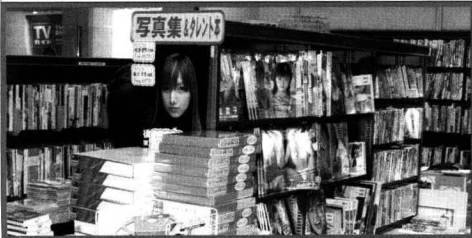
도쿄 시내 서점(福家書店 銀座店)의 사진집·연예인책 코너.

일본 누드 사진집의 대명사는 우리에게도 잘 알려진 《산타페 Santa Fe》(1991)이다. 당시 최