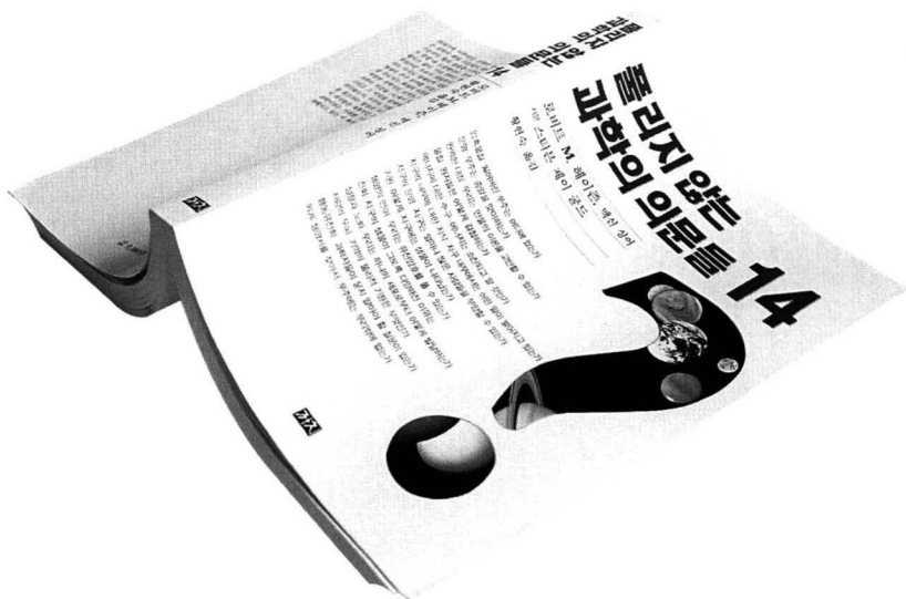
《풀리지 않는 과학의 의문들 14》 로버트 M. 헤이즌 지음 | 황현숙 옮김 | 까치 | 350쪽 | 값 9,000원