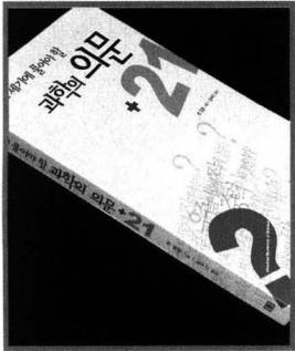
2001년 출간된 《21세기에 풀어야 할 과학의 의문 21》은 과학의 수수께끼를 생명, 지구, 인간, 우주로 나누고 호기심 많은 학생들이 품었던 직한 의문들을 간결하고 재미있게 소개하였다.