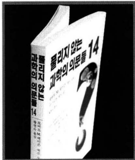
이 책의 미덕은 현대과학이 해결해야 할 과제를 누구나 쉽게 이해할 수 있도록 포괄적으로 설명해놓은 데 있다. 특히 행동유전학 분야에서 과학유리의 한계를 지적한 대목이 돋보인다.

에는 어떤 것들이 있을까? 2003년 11월 11일 미국의 〈뉴욕타임스〉는 과학면인 ‘사이언스 타임스’의 창간 25주년을 맞아 ‘현대과학의 최대 난제 25가지’라는 특집 기사를 무려 15개면에 걸쳐 실었다. 아마도 눈 밝은 과학 독자라면 이 기사 내용을 《풀리지 않는 과학의 의문들 14》(까치글방), 《21세기에 풀어야 할 과학의 의문 21》(이제이북스)과 대조하고 싶은 욕구를 억누르기 어려웠을 터이다.