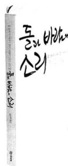
《돌과 바람의 소리》

이타미 준 지음 | 김난주 옮김 | 학교재 | 256쪽 | 값 13,000원