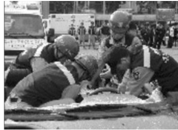
Fig. 7 구조대원의 인명구조시범

지역주민의 소방안전의식을 고취시키기 위하여 연 중 어린이 및 지역주민들에게 소방서를 견학할 수 있는 기회를 제공하고 있다. 유치원 어린이들과 초등학교 저학년 학생들의 견학이 주를 이루고 있으며, 소방차방수시범 및 구조대원들의 인명구조 시범은 물론, 각종 사고의 위기상황에서 당황하지 않고 신속하게 대처할 수 있는 능력을 배양할 수 있도록 어린이 소방안전교실이 운영되고 있다.