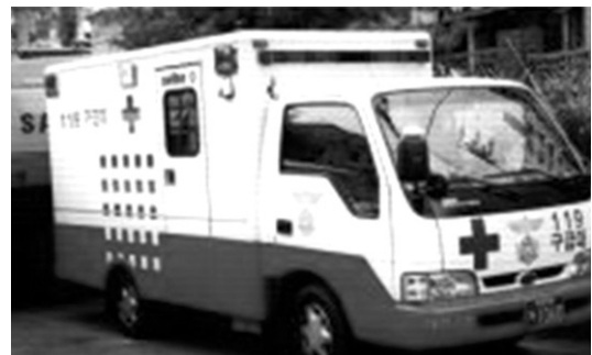
Fig. 6 119구급대

119구급대는 1981년부터 대전, 부산 등 6개 소방관서에서 야간 응급환자 이송업무를 특수시책으로 시범 운영한 것이 최초의 소방 119구급대이고, 83년 소방법에 근거규정을 마련하여 소방의 기본업무로 채택됨으로써 2002년 현재 대전지역에 26개대 119명의 구급대원이 23개 소방파출소에 배치되어 24시간 응급환자 긴급이송체계를 갖추고 있다.