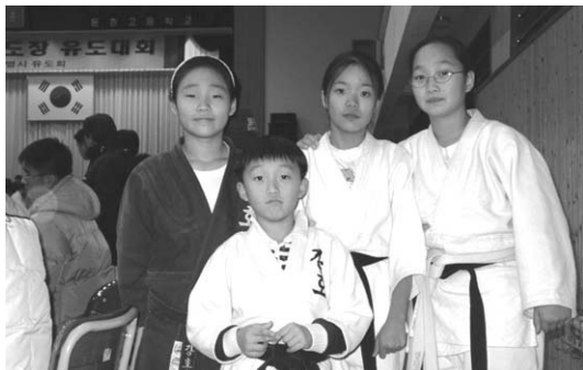
Fig. 9 어린이 유도교실

인천광역시는 97년 8월부터 어린이 유도교실을 운영하고 있다. 전용 유도관을 확보하여 참가자들이 자체적으로 운영하고 있으며 유단자인 소방관이 성심성의껏 지도하고 있다. 현재 20명 내외의 인원이 고정적으로 참가하고 있으며, 각종 유도대회에 참가하여 우수한 성적으로 입상하고 있다. 참가비는 무료이다.