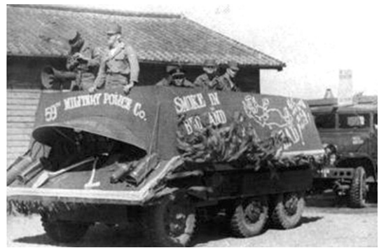
Fig. 2 장갑차의 소방홍보(1940년대)

세계 2차대전의 종전과 동시에 경찰에서 운영하던 소방행정을 중앙소방위원회(소방청), 도 소방위원회(지방 소방청) 및 시·읍·면소방부를 창설·운영함으로써 경찰에서 독립된 자치소방제도를 최초로 시행하였다.