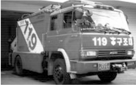
Fig. 5 119구조대

119구조대는 1988.81 중부소방서(당시 대전소방서)에서 9명의 인원으로 화재, 가스폭발, 건물붕괴, 교통사고 등 각종 재난사고 발생 시민의 생명을 구하고 긴박한 위험을 신속하게 수습하기 위하여 발족되었다.