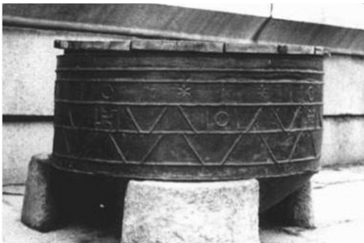
Fig. 1 조선시대의 방화수

경국대전(1485년)의 편찬으로 조선왕조의 금화법령이 그 골격을 갖추었고 세종 8년(1426년)에는 한성에서 연속적으로 발생하는 화재를 진압하기 위해 우리나라 역사상 최초의 금화관서인 금화도감을 당시 병조의 예속으로 설치하였으며, 이후 성문도감과 병합하여 수