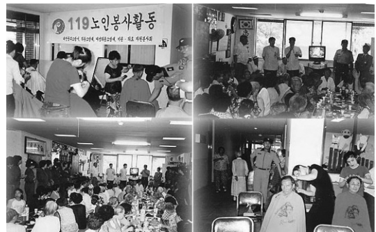
Fig. 8 119 노인봉사활동

소외받기 쉬운 노인들에게 삶의 보람과 사회구성원으로서의 긍지를 갖도록 양로원, 노인복지시설 및 경로당을 대상으로 다음과 같은 봉사활동을 전개하고 있다.