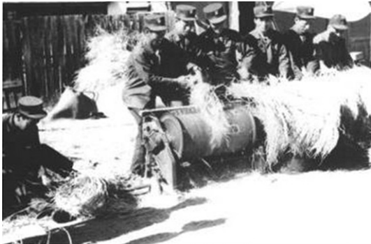
Fig. 4 농촌봉사활동(1970년대)

경찰행정의 일부분으로 인식되던 소방은 1972년 8월 정부조직법 개정으로 경찰로부터 독립성을 확보하였다. 서울과 부산은 자치사무, 기타 시·도는 국가사무로 다루어지는 이원적 행정체계를 유지하여 오다가, 1975년 8월 내무부 민방위본부(소방국)가 신설