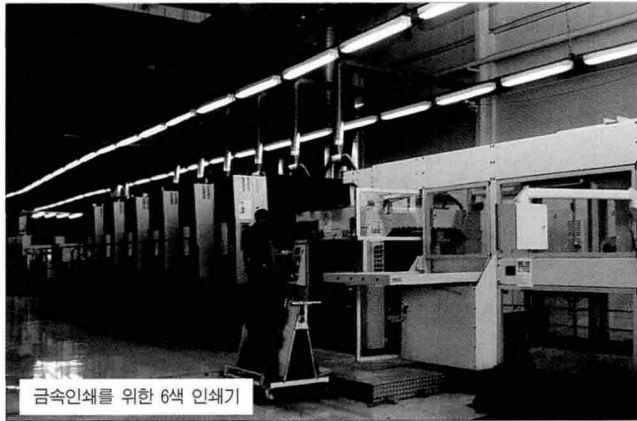
금속인쇄를 위한 6색 인쇄기