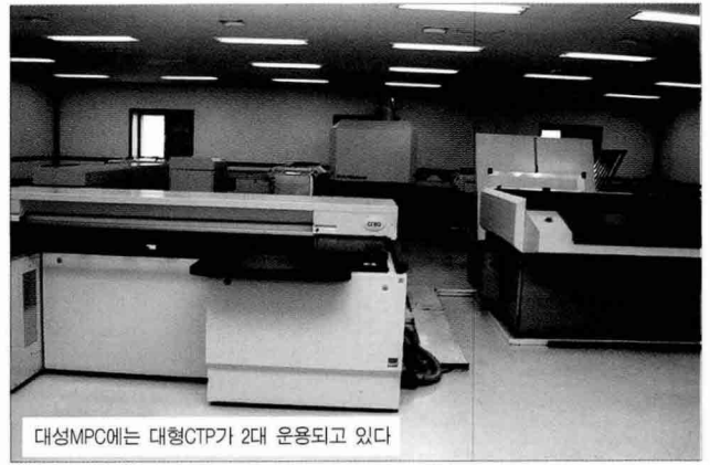
대성MPC에는 대형CTP가 2대 운용되고 있다

이 없어서도 아니다. 단지 사원들이 요구하는 것을 회사측에서 적극적으로 수용해 주는 것과 직원들 스스로가 회사에 기여하려는 의식이 강해서다.