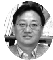
글·손원익 | 한국조세연구원