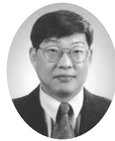
글·최 병 호 | 한국보건사회연구원 연구위원