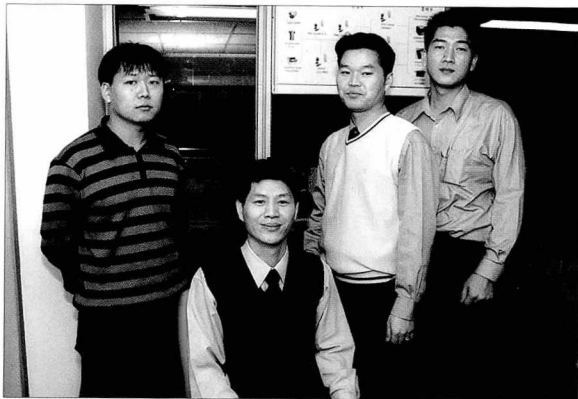
◆ 원비전 직원들

2003년 7월에 국내에 첫선을 보인 PC QuarkXPress에 대한 층무로와 을지로 일대 판권을 확보하고 있는 시스템테크놀로지서비스(주)는 지난 12월 19일 서울시 중구 저동 2가 48-27 금풍빌딩 304호에 QuarkXPress 센터의 임무를 수행하게 될 (주)원비전(02-2278-4723)의 개소식을 가졌다.