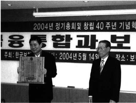
2004년도 보험문화대상 수상

연구원은 지난 5월 14일, 그간 연구원이 수행해온 시험연구, 품질인증, 방재교육 등을 통해 보험산업의 과학화 및 국가 방재기술 향상에 기여한 점을 높이 평가받아 한국보험학회가 수여하는 보험문화대상을 수상했다.