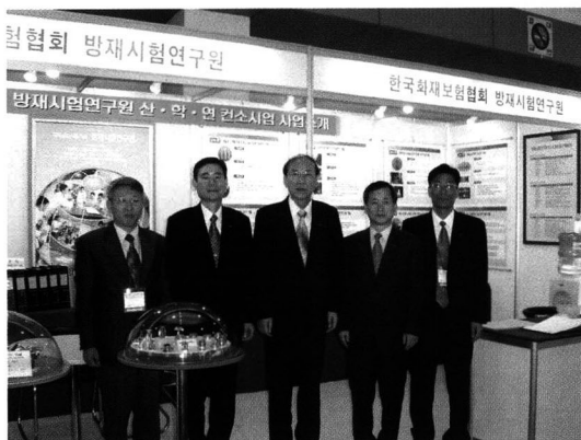
중소기업 기술혁신대전 참가

연구원은 지난 8월 27일, 『한국안전전문기관협의회』 여름 정기회의를 개최하여 각 분야 전문가들과 함께 안전 관련 세미나 및 토론회를 가졌다.