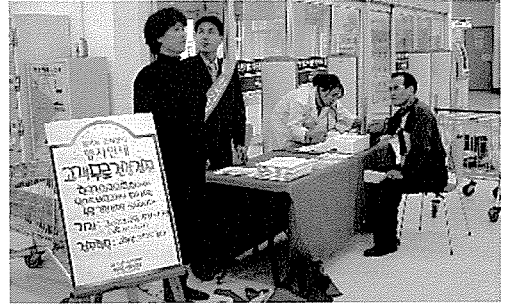
▲ 울산지부는 아동복지시설인 키즈레몬어린이집, 일산중학교 외 1개교 등의 원생 및 중식지원학생 40여명에게 무료건강검진을 실시했다.