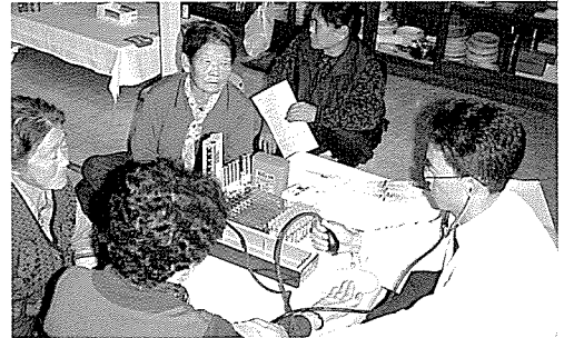
▲ 전북지부는 정읍시 관내 장애인, 일반주민, 기초생활보장수급권자 등 410여명에게 무료건강검진을 실시했다.