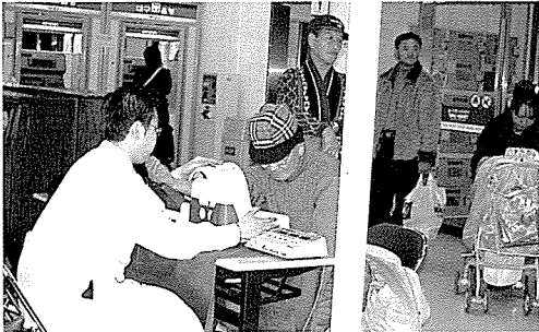
▲ 대구지부는 아동복지시설인 홀트, 노인복지시설인 상인복지관, 비산초등학교 외 8개교 등의 원생 및 중식지원학생, 일반주민 1,510여명에게 무료건강검진을 실시했다.

한국건강관리협회는 봉사와 희생을 실천하고 있습니다. 지난 12월 한달 동안에도 9천 3백 여명에게 무료건강검진과 건강상담을 실시하여 아름다운 만남을 실천하였습니다.