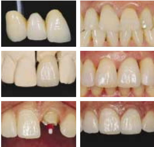
〈그림 12〉 여러 임상 case의 각기 다른 surface texture & luster

원할 하게 유지 될 때 미래에 더욱 발전된 서로의 모습을 보게 될 것이다. (자세한 내용을 알고 싶으신 분들은 ceramist들의 커뮤니티 http://cafe.daum.net/dentalcsc 로 연락주시요.)