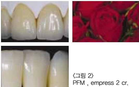
〈그림 2〉 PFM , empress 2 cr.

우리에게는 예술적 능력을 발휘 할 수 있는 작업환경도 필요하고 우리가 완성한 작품들이 감상 할 수 있는 정도의 완성도를 갖는 것도 중요 하지만 그 작품들이 환자구강 내에서 실용적이지 못할 경우는 이 모든 사항이 무의미하게 되는 것이다. 그러므로 우리 dental technician은 치과 의사, 환자와의 관계 중요성을 인식하며 자연을 재현하려 노력해야만 할 것이다.