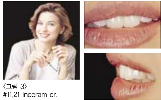
〈그림 3〉 #11,21 inceram cr.

restoration 대한 관심도가 더욱 높아 지는 것도 그 이유의 하나 일 것이다.