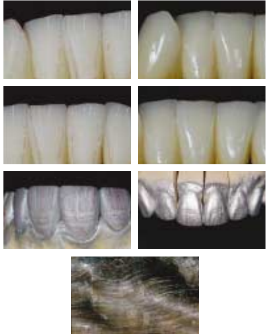
〈그림 9〉 자연에 근거한 형태와 표면구조 재현과 확인방법-silver powder 사용

다양한 환자 case를 접하다 보면 교합, 치주, 안모, 입술 등 여러 요소들이 우리 Ceramist들을 괴롭힌다. Ceramist라면 외국의 대가들과 같이 자연스럽게 다양한 시도를 해보고 싶을 것이다. 하지만 우리나라 환자들의 성향을 보면 선호하는 나름대로의 형태와 색상이 있다 보니 일상적인 형태나 색상에서 벗어나기가 어려울 수도 있다.