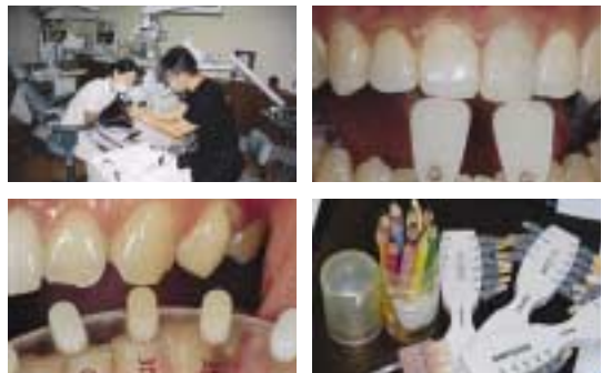
〈그림 7〉 작업실과 진료실은 환자의 정확한 정보가 공유되는 관계가 되어야 한다.

하지만 원칙에서 벗어난 정보는 생각보다 많은 도움이 안될 수 있다. 그래서 치과와 기공소 간에는 항상 정해진 규칙에 의해 정보가 전달되어야 하며 가장 좋은 방법은 번거롭지만 직접 환자를 대면해서 정보를 얻어 오는 것이다.