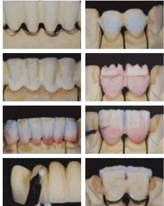
〈그림 10〉 PFM case build up 과정