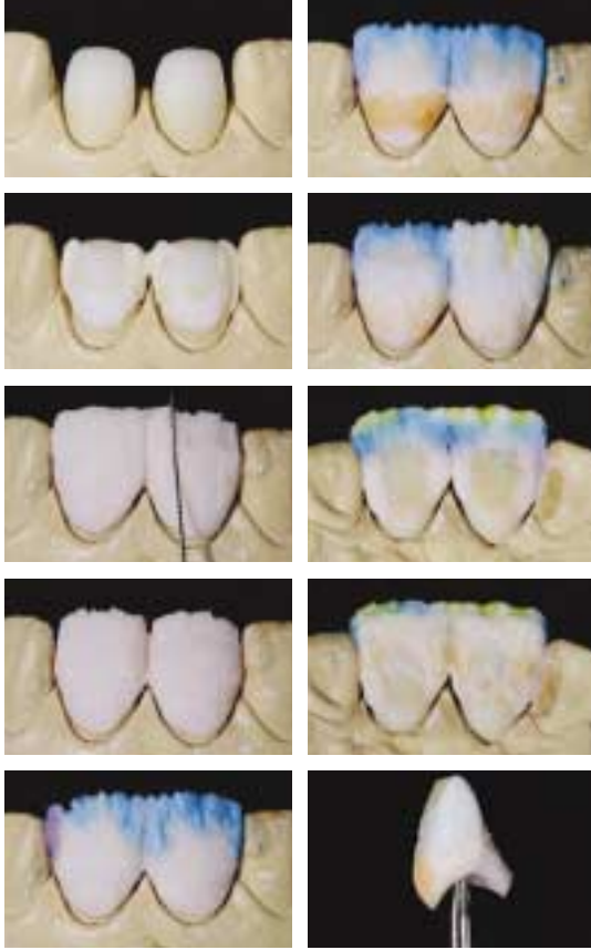
〈그림 11〉 #11,21 empress 2 cr. Build up 과정