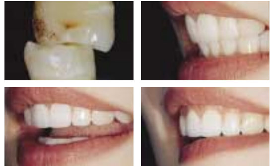
〈그림 4〉 cr.시적 후 기능과 심미 check - #11,21 empress2 cr.

전치부 형태를 수복하는 경우 대부분 case 에서 전치유도를 하도록 한다.