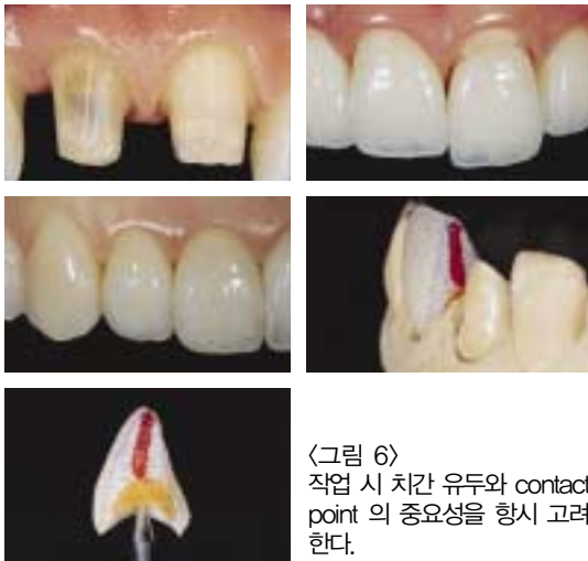
〈그림 6〉 작업 시 치간 유두와 contact point 의 중요성을 항상 고려한다.

치아와 더불어 치은도 중요한 역할을 하며, 치아의 심미가 아무리 우수해도 주위조직이 건강하지 못하면 심미를 달성 할 수 없다.