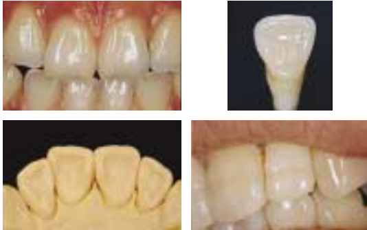
〈그림 5〉 기능이 고려 된 심미는 더욱 빛을 발한다.