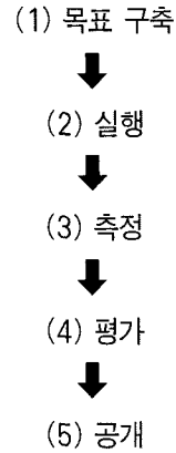
〈그림 2〉 학습 성과 실행 확인을 위한 “Close-the-loop”