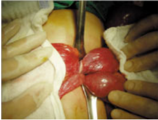
Fig. 3. Intraoperative photograph shows ileal mesenteric band composed of fibrous band compressing the bowel.