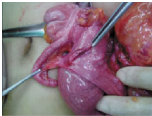
Fig. 4. Operative appearance of mesodiverticular band.

mmol/L이었다. CRP는 0.9 mg/dL을 보였으며, 대변에서 적혈구나 백혈구는 관찰되지 않았으며 혈액 및 대변 배양 검사에서 균은 자라지 않았다.