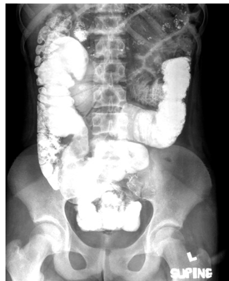
Fig. 2. Small bowel series shows obstructive lesion of distal ileum in left lower pelvic cavity.

환 아: 정○○, 11세, 여아 주 소: 내원 2일 전부터 시작된 복통과 구토 과거력: 과거 복부 수술을 받은 적은 없었다. 현병력: 이전에 건강했던 11세 여아로 내원 2일 전부터 복통과 구토 증세 보여 응급실을 경유하여 소아과로 입원하였다. 발열과 설사는 없었다. 진찰 소견: 입원 당시 체온은 36.5°C, 호흡수는 21회/분, 맥박은 98회/분, 혈압은 110/70 mmHg이었다. 급성 병색 소견은 보이지 않았으며 호흡음은 깨끗하였으며, 복부는 약간 팽만되어 있었으며 우하복부의 통증 소견과 장음은 증가되어 있었다. 간비 종대나 피부 발적 소견은 관찰되지 않았다. 검사 소견: 입원 당시 일반 혈액 검사상 백혈구 13,900/mm 3 (호중구 85%, 림프구 7%, 단핵구 8%), 혈색소 14.1 g/dL, 적혈구 용적 42.4%, 혈소판 243,000/mm 3 이었고, 적혈구 침강 속도는 7 mm/hr였다. 생화