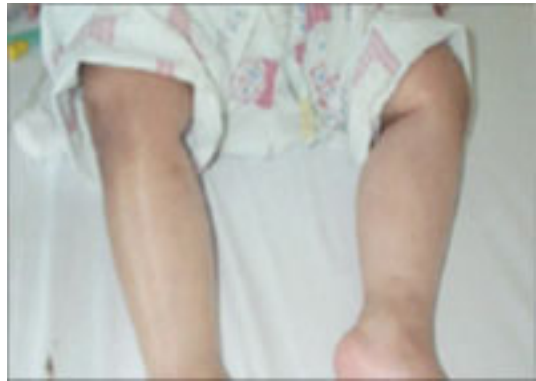
Fig. 2. Lower extremity shows edematous appearance.