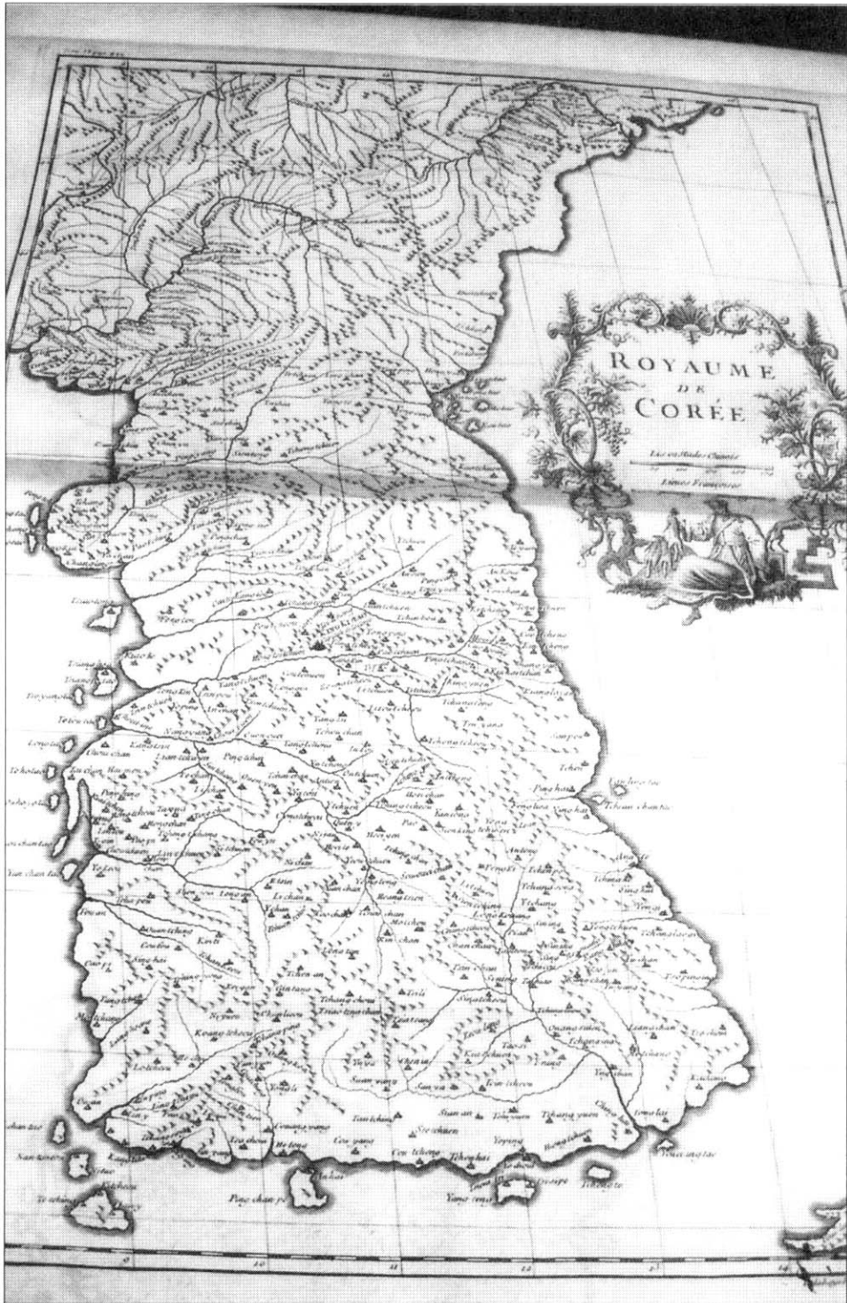
그림 1. 당빌의 조선도(1735, 51.8×35.3cm)