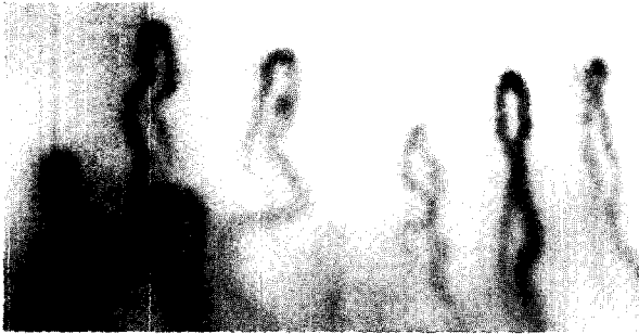
Fig. 2. Nail Fold Capillary

영상을 컴퓨터에 입력하기 위해서는 영상 오버레이 보드가 필요하다. 오버레이 보드를 통해 입력되는 영상은 MPEG규격이나 AVI규격으로 저장이 가능하다. 입력되는 영상 중 필요한 상태는 JPEG파일이나 BMP파일로 저장을 한 후 영상 분석에 사용된다.