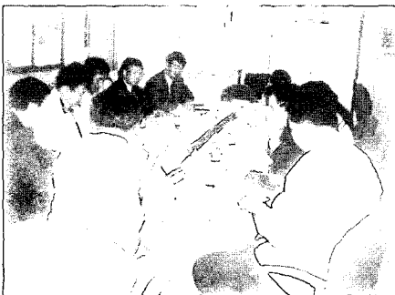
[협력업체 대표이사 간담회]

안전관리 우수협력업체에 대한 협력업체 포상과 인센티브 부여로 협력업체의 자율안전관리 정착을 위한 적극적인 참여를 지원하고 있다