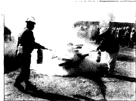
[전 작업자 소방교육]