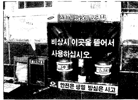
[정리된 작업장 환경 구축]

현장별 주간안전관리계획서의 위험예상 공중의 검토와 안전 시설의 종류 및 안전조치상태를 「안전관리정보시스템에 의한 자료확인」으로 적기에 정보전달 실시로 불안정한 요소의 사전 예방조치와 작업의 안전을 확보하고 있으며