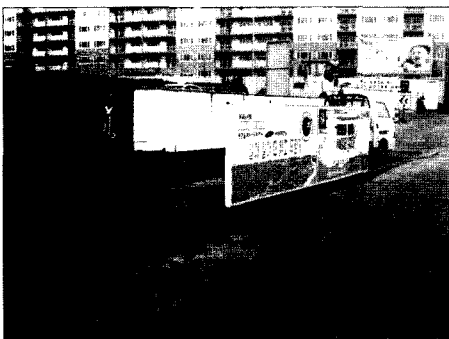
[시각적 안정감 - 세륜시설]