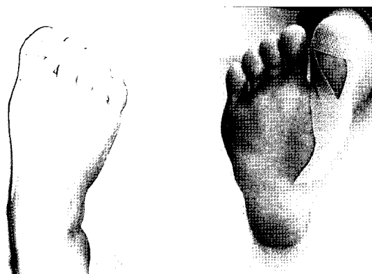
<Fig 1> Method of Taping therapy