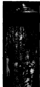
<그림6> 로랑 메르시에 VOGUE KOREA (2002. 12). p.23