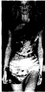
<그림22> Roberto Cavalli VOGUE KOREA (2002. 12). p.45