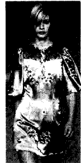
<그림14> Andrew GN VOGUE KOREA (2002. 12). p.25