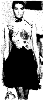
<그림 27> Anna Molinari VOGUE KOREA (2002. 12). p.40