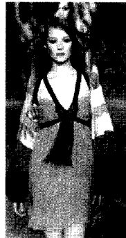
<그림11> Andrew GN VOGUE KOREA (2002. 12). p.25