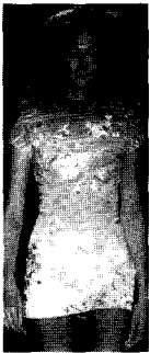
<그림21> Gucci VOGUE KOREA (2002. 12). p.30