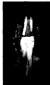
<그림1> L'OFFICIEL (2003. 3). p.141

오리엔트 문화의 특징인 정결함, 고요함, 간결함, 그리고 절제 혹은 민족의상 그 자체의 실루엣이나 겹겹이 입는 성장(盛裝) 차림새에 의해 연출되는 사각형 실루엣은 현대패션의 실루엣 경향에 영향을 미쳤다. 이는 현대패션에서 주로 볼 수 있는 인체를 조이면서 나타나는 인체 곡선미의 표현보다는 의상의 느슨함 속에서 인체를 자연스럽게 드러나게 하는 인체 곡선미를 부각시켰다. 또한 여성의 인체 곡선을 강조하여 드러나게 하는 아우어글래스 실루엣이나 S자형 실루엣의 디자인에 익숙한 서양 디자이너에게는 여성 인체미의 표현을 위한 실루엣에 대한 인식의 변화를 가져오게 하는데 영향을 미쳤다. 즉 신체를 구속하지 않는 느슨한 straight 실루엣, drape 또는 layered 착장법에 의해 표현되는 실루엣, 의상 그 자체의 사각형 실루엣과 허리 벨트와의 매치를 통해 연출되는 H라인 등을 포함한 단순한 사각형 실루엣은 인체의 자유로운 움직임을 강조하면서 과장되지 않은 자연스러운 형태미를 나타내는 디자인을 유행시키는데 영향을 주었다. <그림1>은 사각형 실루엣인 일본의 기모노 스타일을 연상케 하는 작품이다. 이 실루엣은 인체의 움직임에 따라 선의 방향이 유동적으로 바뀌게 되어 심플한 형태에서도 인체의 움직임에 따른 리듬을 느끼게 한다. <그림2>는 이영희(Young Hee Lee)의 작품으로 일본, 한국 등의 지역에서 볼 수 있는 여러 종류의 의상을 겹쳐 입는 성장(盛裝) 차림새에 의해 연출되는 사각형 실루엣의 한 형태이다. 여러 의상을 겹쳐 입는 착장법을 통하여 형성되는 사각형 실루엣은 인위적으로 인체의 곡선