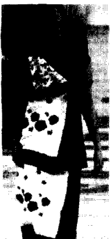
<그림3> Antonio Marras 패션 디자인 발상. 교문사. (2001). p.213

이상과 같이 중국, 일본, 한국 등의 전통의상이 현대패션의 디자인 테마로 부각되어졌으며, 이들 전통의상에서 찾아볼 수 있는 사각형 실루엣은 현대패션과 접목되었을 때 보다 단순하고 간결한 선의 사각형 실루엣으로 표현되었고 인위적인 인체선의 표현보다는 인체의 움직임에 따른 자연스런 율동감을 느끼게 함을 알 수 있다. 이러한 특징은 오리엔탈 의상은 서양의상과는 본질적으로 형태미에서 특성이 나타나는데, 서양의상은 신체의 곡선을 나타내는 것에 비해 오리엔탈 의상은 복식을