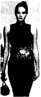
<그림26> Anna Molinari VOGUE KOREA (2002. 12). p.40