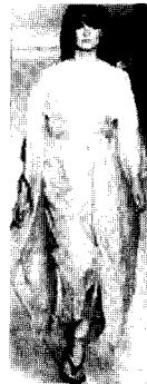
<그림5> 로즈마리 로드리게즈 VOGUE KOREA (2002. 12). p.22

<그림5>는 로즈마리 로드리게즈(Rosemari Rodriguez)의 작품으로 일본의 기모노 스타일에 기모노 소매를 해체 재구성한 넓고 긴 소매와 오비지메를 연상케 하는 허리끈으로 여밈은 H라인을 선보이고 있다. <그림6>은 로랑 메르시에(Laurent Mercier)의 작품으로 중국의 전통의상인 치파우를 블라우스 형태로 디자인한 사각형 실루엣을 선보이고 있다. <그림7>은 크리스찬 디올(Christian Dior)의 작품으로 중국의 치파우를 모티브로 하여