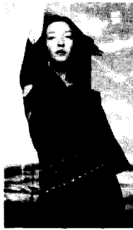
<그림25> Kenzo VOGUE KOREA (2000. 3). p.249