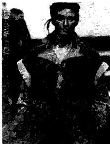
<그림23> Yohji Yamamoto marie claire KOREA (2002. 12). p.50