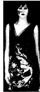
<그림16> ALEXANDRE VASILIEV Fashion Insight (2003. 1). p.70