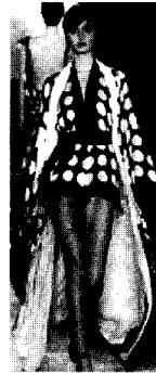
<그림9> Donna Karan VOGUE KOREA (2002. 12). p.50

오리엔탈리즘의 문화를 색채로 표현한다면 극도로 절제된 무채색이나 강렬함과 화려함을 주는 유채색의 양면적인 특징으로 나타낼 수 있다. 즉 종이와 먹물을 연상케 하는 무채색 대비를 통한 간결미와 여백미, 흑-백색 같은 무채색 외에 밤색, 카키색, 겨자색 같은 차분하면서도 자연과 가까운 색상들 간의 대비를 통한 순수미와 자연미, 오렌지색, 포도주색, 붉은 기운이 있는 보라색 등 화려한 색상들 간의 대비를 통한 화려미로 대별된다. 따라서 현대패션에 표현된 오리엔탈 색채 이미지는 정결하고 고요한 느낌을 특징으로 하는 '젠(zen) 스타일'의 영향으로 거추장스러움을 철저히 털어내고 간결함을 추구하면서 보다 따뜻하고 부드러운 자연스러운 느낌과 이에 비해 결감과 안감의 보색 사용, 한국의 색동에서 모티브를 얻은 오색 사용, 무채색과 유채색에 의한 톤(tone) 차에 의한 보색배색을 통한 화려한 느낌으로 나타났다. 이외에도 네 크라인 부분(깃부분), 소매단, 오비와 오비지메를 모티브로 한 허리벨트 등에 화려한 색상을 액센트로 사용함으로써 그 대비에 의해 양자가 지닌 색채미를 최대한 높여 산뜻하고 밝은 이미지를 연출하였다 18) . <그림9>는 도나 카란(Donna Karan)의 작품으로 일본의 기모노 스타일에 오리엔탈리즘의 정적인 느낌을 주는 검정색과 흰색의 명도차에 의한 대비배색을 이용하여 절제미와 간결미를 잘 표현하고 있는 작품이라 할 수 있다. <그림10>은 박윤수(Youn Soo Park)의 작품으로 한국의 색동에서 아이디어를 빌려와 이를 재현시킨 오색 스카프로