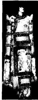
<그림7> Christian Dior L'OFFICIEL KOREA (2002. 4). p.262