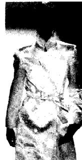
<그림15> OSCAR DE LA RENTA Fashion Insight (2003. 1). p.63