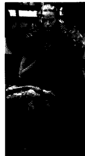
<그림17>Junya Watanabe VOGUE KOREA (2000. 8). p.266