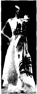
<그림19> Christian Lacroix VOGUE KOREA (2000. 3). p.333

이상과 같이 오리엔탈 소재로 사용된 실크, 사틴, 자카드 등의 소재는 현대패션에서의 오리엔탈리즘 표현의 아이템으로 사용되었으며, 운문, 연꽃문, 용문 등의 오리엔탈 에스닉 패턴을 중심으로 2-3개 이상의 모티프가 매치되거나 수북화, 간결한 붓터치에 의해 표현된 패턴 등은 오리엔탈리즘 경향으로 나타났음을 알 수 있다.