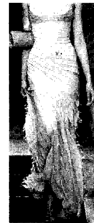
<그림18> Versace VOGUE KOREA (2000. 3). p.333