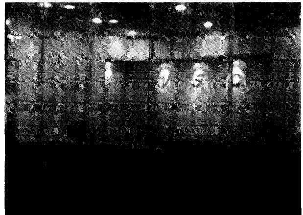
그림 3 VSQ 창업동아리 사업장