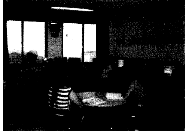
그림 2 개별 프로젝트 실