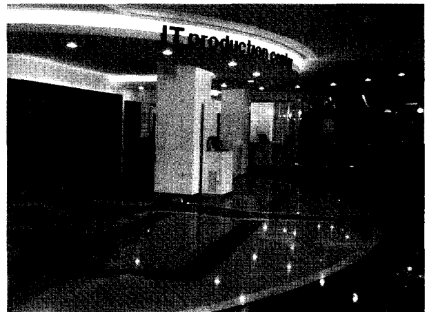
그림 4 건물 로비