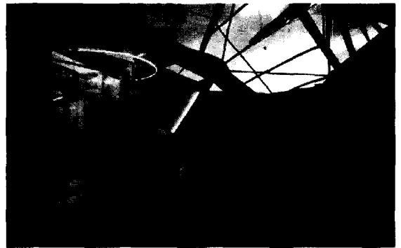
<그림 3> 쿵 힘멜브라우, 법률사무소 옥상증축 내부전경, 1989

쿵 힘멜브라우(C. Himmelblau)의 법률사무소 옥상증축은 무의식적이고 우발적인 디자인 과정을 추구하며 합리성이나 계획된 이성적인 두뇌의 수단보다는 손에 의한 감각적이고, 순간적인 창작과정을 통해 우연적으로 형상을 결정하게 된다. 그래서 생각되지 않은 자동적인 드로잉과 모델작업을 통해 전혀 자연적이지 않으며 일상적이지 않고 정형화된 틀에서 벗어나는 즉, 기존의 구조와 가치를 해체하게 되고 궁극적으로는 시간적, 공간적 제한에서 일탈하는 독창적인 형상을 가지게 된다. 공간적인 감각형식이 일탈하는 과정은 투시도적인 일상의 인지과정의 해체로 해석할 수가 있다. 중력방향에 대항하여 건축된 일반적 구조물에서 보여지는 명료한 수직, 수평의 투시선들은 규칙적인 요소들의 배치와 기하학적인 형태를 통해 익숙한 모습으로 공간이 인지되는 반면에, 우연적인 곡선과 사선에 의해 이루어진 공간은 그 깊이와 형태에 있어 쉽게 상상되지 않는다. 단지 거리감에 의해 공간의 깊이를 느낄 수 있으며, 실제로 표면의 질감과 명암처리에 의해 공간의 깊이와 형태가 왜곡되어 전혀 다른 현실감을 가지게 된다.