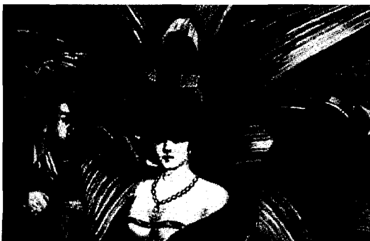
<그림 7> 막스 에른스트, 백가지 모습의 여인 1929

콜라주, 아상블라주는 사람들로 하여금 부조리한 충동이나 아이러니컬한 연쇄반응을 노리는 기법이다. 피카소나 브라크에게는 단순한 미적 수단에 불과하지만 다다이즘에서는 붙여지는 물체 자체에 의미를 두기 시작한다. 에른스트(M. Ernst)의 “백가지 모습의 여인”이라는 작품을 통해 초현실주의적인 콜라주를 확립했다.