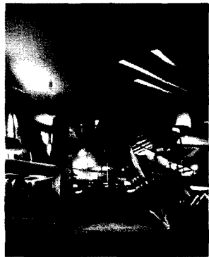
<그림 2> 자하 하디드 문순 레스토랑, 1990