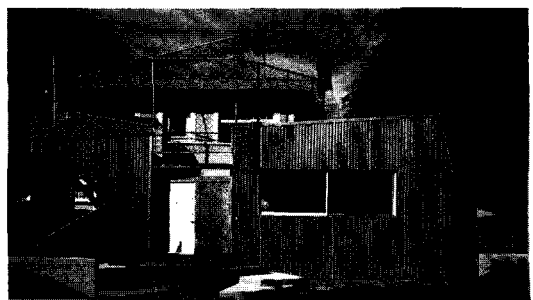
<그림 8> 프랑크 게리, 게리하우스, 1978