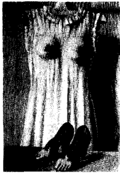
<그림 4> 르네 마그리트, 내실의 철학, 1947

이와 같은 시각적 유희는 두 가지 다른 의미의 병합으로부터 성립한다. 즉, 서로 다른 의미와 형태를 지닌 것을 함께 병합함으로써 공간적이거나 시간적인 병치와 조작의 효과를 가지게 되며 전혀 다른 새로운 대상을 창출해 낸다.