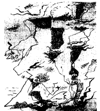
<그림 1> 앙드레 마송, 기사, 1927

초현실주의의 마술적 기법의 비결이라고 불리는 자동기술법은 지극히 우발적인 사건으로 무계획적이고 무원칙적인 우연적 형상들로 구성된다. 즉 무의식에 떠오르는 생각들을 아무런 규칙이나 의도 없이 받아쓰는 기법이다. 결과적으로는 억제된 욕망들을 의식의 표피로 떠오르게 하는 작업이다.