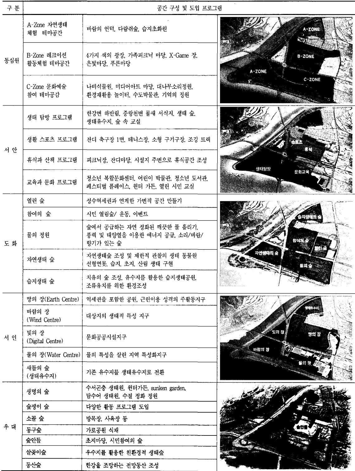
표 7. 각 설계안의 공간 구성 및 도입프로그램 비교