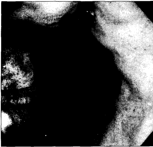
Fig. 1. Preoperative esophagogastroscope shows 2 cm sized round, deep ulcer in lesser curvature side of stomach. There was a 0.7 cm sized fistula opening that was connected with right bronchus in the ulcer lesion.