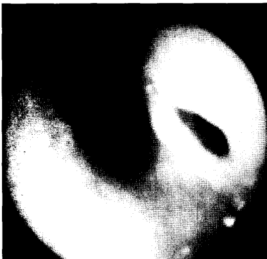
Fig. 2. Preoperative bronchoscope shows a fistula opening in the right main bronchus.

었다. Ivor Lewis 수술 시행한 후 발생한 위기관지 누공으로 진단되어 수술을 시행하였다. 수술은 우측 개흉술로 5번째 늑간으로 흉강내로 들어갔다. 우측 주기관지 부위에 심한 유착이 있었고, 유착 박리 후 위부위에 고름주머니가 있었고 위기관지 누공이 관찰되었다. 누공 박리와 분리한 후 기관지 개구부는 바이크릴(vicryl) 4-0 & 3-0을 이용하여 단속봉합하였다. 위 개구부는 바이크릴 3-0와 겹겹 전사 3-0을 이용하여 이중(double layer)으로 봉합하였