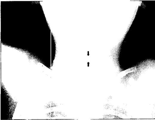
Fig. 1. Plain radiograph shows foreign body shadow in the subglottic region(arrow).

곤 정상으로 회복되었다. 기관절개를 통한 전신마취 후 현수후두경하에서 성문부를 완전히 지나 성문하부에 게재되어 있는 치아를 확인하였으며, 이를 이물겸자를 이용하여 조심스럽게 제거하였다(Fig. 2).