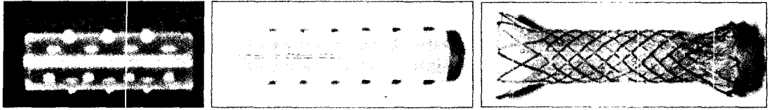
Fig. 1. 현재 많이 쓰이고 있는 기도스텐트. 왼쪽에서부터 Dumon 스텐트 (실리콘 스텐트), Natural 스텐트 (실리콘 스텐트), Song 스텐트 (금속 스텐트)

펴질 수 있는 특징을 가지고 있다. 시술은 주로 방사선과에서 투시경을 하면서 시행하고 삽입 방법이 비교적 용이하나, 일단 삽입하면 제거나 위치 변경하기가 불가능하다는 단점이 있다. 실리콘 스텐트는 L-튜브와 같은 실리콘으로 만들어졌으며 약 1mm의 두께를 가지고 있어 내경이 외경보다 2mm작다. 전신마취하에 경직성기관지내시경을 통해 삽입하므로 경험있는 전문 의사가 있어야 하며, 위치변경 및 제거가 항상 가능하다는 장점이 있다.