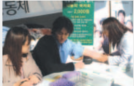
골수기증희망신청서 작성 후 채혈을 하고 있는 모습.