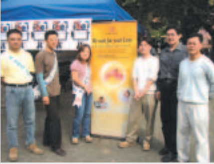
기증자분들과 협회 나정화 주임이 캠페인 도중에 포즈를 취해 주셨네요..!

2003년 9월 26일 탤런트 김명국 님이 기증자분들과 함께 대학로 마로니에 공원에서 캠페인을 하고 있는 모습.