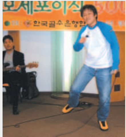
폭발적인 무대 매너를 보여주신 이상기 님 서태지와 아이들의 '난 알아요'를 멋드러진 춤과 함께 불러주셨습니다. 이날 인기를 실감하셨겠네요..*^^*