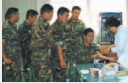
교육 후에 골수기증희망자로 동참하고자 채혈하고 있는 모습.

10월 24일에 명동 밀레오레 앞에서 로또 공익재단과 함께 골수기증희망자 모집 캠페인을 열었습니다.