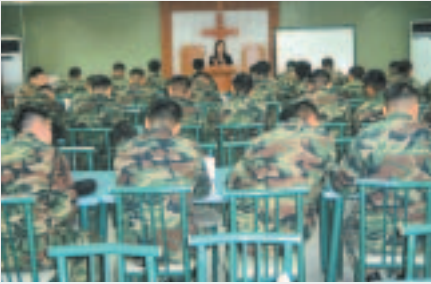
골수기증 필요성에 대하여 교육을 받고 있는 장병들.

10월 하순부터 12월 초순까지 군부대를 방문하여 기증희망자를 모집하였습니다.