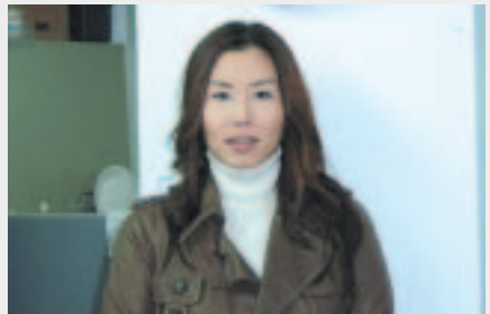
협회 사무실에서 기념 촬영 한방^^