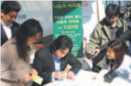
텔런트 소지섭 씨도 골수기증희망신청서를 작성하고 계시네요.

10월 24일에 명동 밀레오레 앞에서 로또 공익재단과 함께 골수기증희망자 모집 캠페인을 열었습니다.