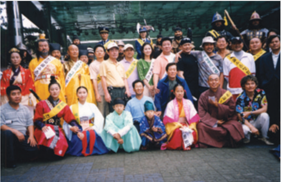
골수기증희망자 모집을 위한 캠페인 활동 후 한자리에 모여...