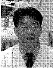
글 | 윤진석 잠실 한승병원/대장항문과 과장