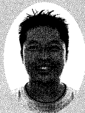
글 | 김연식 한국화장실 문화협회 연구실장