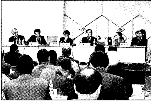
사진 1. 고관급 회담(SOM) 전경

과 이용을 강조하고 있는 "각료제안서"의 내용에 대한 적극적인 지지 표명과 이의 실천을 위해 각국의 노력을 강조하였다.