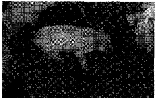
〈사진 2, 3〉 자돈에서 나타나는 호흡곤란, 위축 증상

〈사진 2, 3〉은 어떤 영업사원이 농장을 방문해서 이유자돈의 상태를 보고 그간의 사고율(40~70일령에 8%~12%)을 듣더니 PMWS라고 진단하고 PMWS는 해결방법이 사실상 없으므로 농장을 완전히 비웠다가 다시 채우던가 아니면 이참에 농장을 관두는 것이 낫다는 참으로 황당한 얘기까지 들은 농장의 해당 자돈을 찍은 것이다.