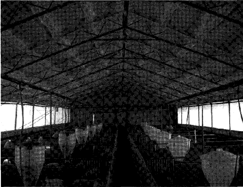
〈사진 4〉 개방식 돈사. 적절한 단열과 합리적인 자연환기 시스템으로 어린 자돈을 잘 키우는 농장의 예이다.

면 설령 그 농장에 진짜 PMWS의 원인체가 존재한다 하더라도 그 피해는 그렇지 않은 농장에 비해 크게 감소할 것이다.