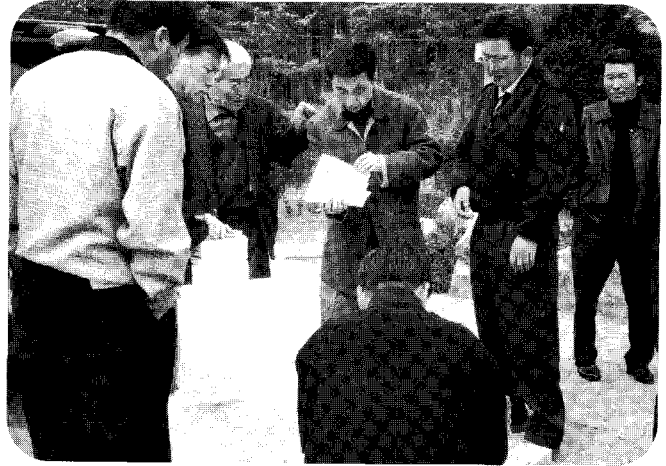
▲<자료사진> 예방접종 중단(2001. 12. 1) 이전 시·군공무원이 양돈농가에 돼지콜레라 백신을 나눠주고 있다.(경기 양평)

○예방접종지역의 예방약공급반 및 예방접종반이 예방약 공급 및 예방접종 실시후 작성, 시·군(읍·면)에 제출