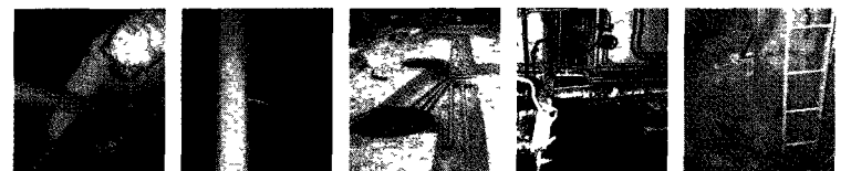
■탱크청소공사 ■탱크내부라이닝 ■탱크 및 배관보수 ■유류사고 긴급보수 ■탱크 용도폐지공사