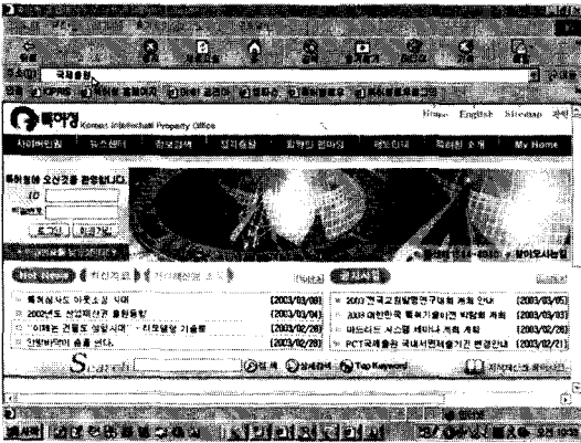
(그림 1) URL 입력창에 “국제출원”이라고 입력한 상태

(그림 1)은 URL입력창에 한글로 “국제출원”이라고 입력한 익스플로러 화면입니다. (그림 2)는 그림1의 상태에서 입력버튼을 누르므로 페디슨국제특허 홈페이지의 도메인 “www.pedison.com”을 입력하지 않고도 페디슨국제특허의 홈페이지에 접속한 익스플로러의 화면입니다.