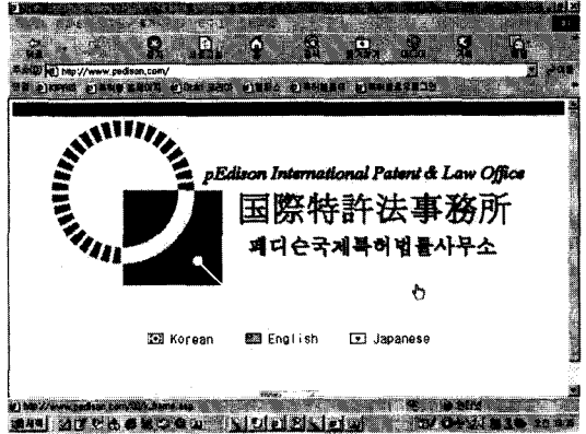
(그림 2) 페디슨국제특허 홈페이지로 이동한 상태

한글키워드 서비스가 해당 홈페이지로 연결되지 않거나 해외에서 한글인터넷주소를 사용하실 경우 아래와 같은 방법으로 한글인터넷주소를 사용하실 수 있습니다.