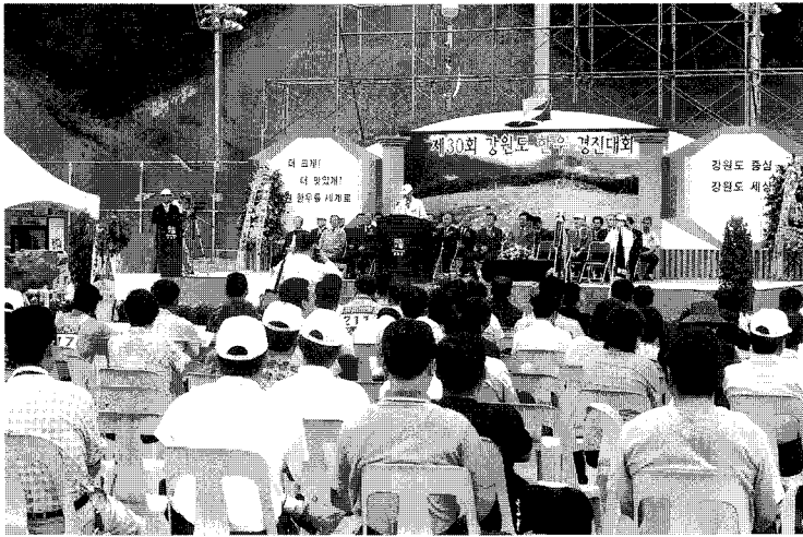
◀ 강원도가 한우산업 육성을 위해 매년 개최하고 있는 「강원도 한우 경진대회」 모습.