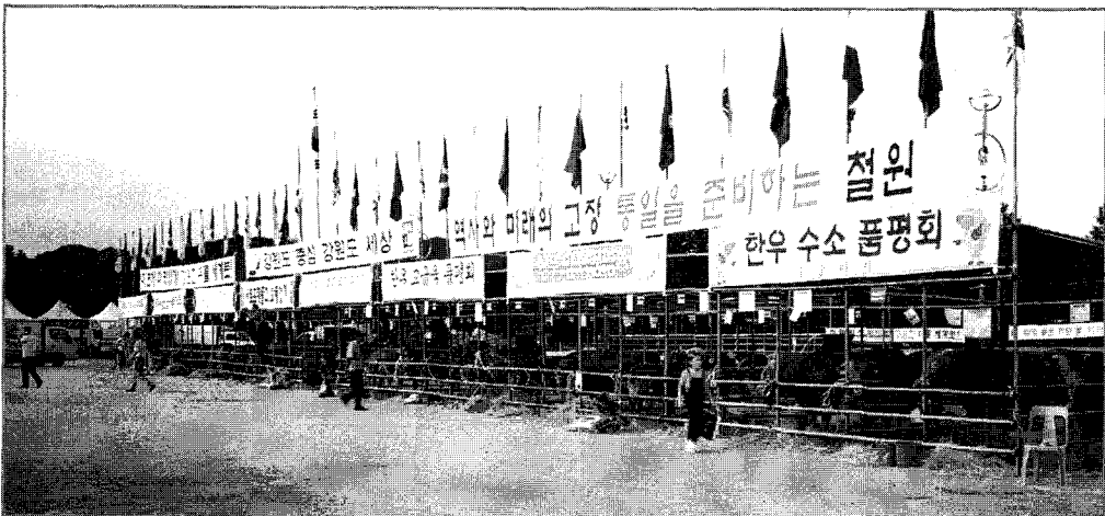
▲ 강원도는 최근 한우 광역브랜드 육성 사업계획을 확정, 강원도내 4개 권역별 한우브랜드 육성을 적극 추진하고 있다. (사진은 올해 철원에서 개최된 한우경진대회 모습)