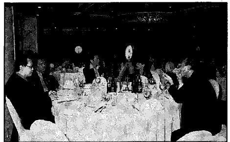
▲ 환영 리셉션 (타워호텔)

특히 개정된 ISO 6780의 개정경과 및 주요내용 해설 주제(발표자 : JPA 후쿠모토 전무이사) 발표를 통하여 아시아 태평양 지역의 유일한 국제표준규격으로 확정되었음을 확인하고 이에 대해 별다른 이의가 없었으며 이를 받아들였다.