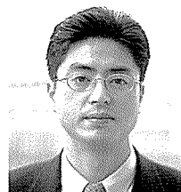
글 / 채동진 동우대학 제과제빵과 학과장 · 교수