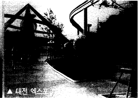
▲ 대전 엑스포