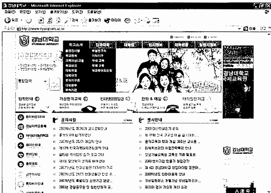
▲ 경남대학교 홈페이지

경남대학교는 1998년에 21세기 대학의 미래상과 대학발전의 청사진이 될 '신대학발전계획'을 수립하고, '세계화·지방화를 실천하는 21세기형 지방대학의 모델 구축'을 위한 의욕적인 새출발을 선