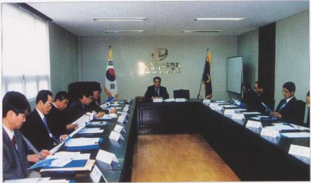
2003년도 홍보교육위원회 제1차 회의(4. 23) 상하수도 관련대국민 홍보 및 관계자들의 교육 실시